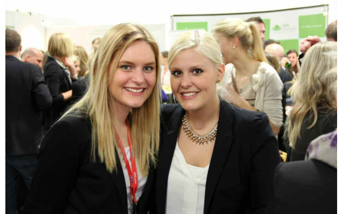
Messteam - Teilnehmerinnen

Ein weiteres Ziel war es, wichtige Kontakte zu Wissenschaft und Praxis zu knüpfen, bestehende Kooperationen zu pflegen und potentiellen Studierenden zu begegnen sowie im Dialog Wissenschaft und Praxis zusammenzuführen, u.a. um Synergieeffekte zu nutzen, dies unter der Dachmarke „Market Trends & Innovations (MTI)“, in Halle 5.1.