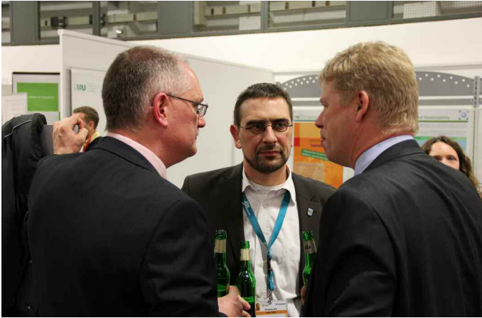
Dreiergespräch: in der Mitte Sven Ambrosy, Landrat des Landkreises Friesland, Vorsitzender des Tourismusverbandes Nordsee e.V. (seit 2004) und des Tourismusverbandes Niedersachsen e.V. (seit 2006).