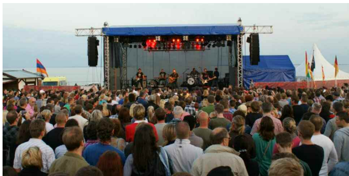
Life Musik auf der Südstrand-Bühne mit Meerblick

Vom Pumpwerk, wo historische Marktleute, Künstler, Piraten und Rittersleute die Besucher einladen, an ihren Marktständen zu stöbern und zu feilschen, über die Wiesbadenbrücke, wo es allerlei Oldtimer zu bestaunen gab, bis zum Bonte Kai und Südstrand wurde an Ständen gestöbert, gegessen und getrunken. Kulinarisch reichte es von Fisch über Crêpes bis zur mediterranen Küche und Grillspezialitäten. Ein Flohmarkt auf der Deichbrücke und die Kirmes am Hafen rundeten das Angebot ab.