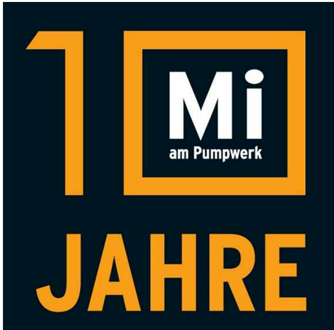
LOGO Mittwochs am Pumpwerk

Veranstaltungstechnisch hatte Wilhelmshaven diesen Sommer wieder viel zu bieten: traditionsmäßig war ab Mai jede Woche Mittwochs am Pumpwerk Live-Musik angesagt und das Wochenende an der Jade war auch wieder ein Erlebnis.