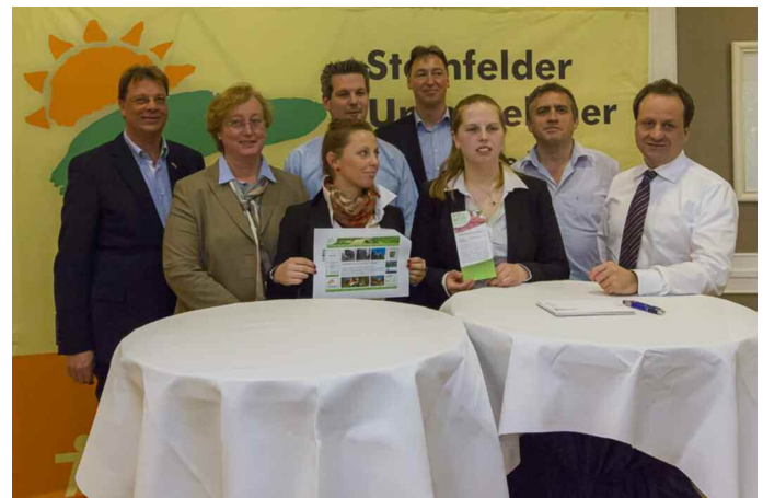
... Vorstellung des erarbeiteten Kommunikationskonzepts.