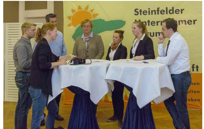
Spannende Diskussionen bei der ...