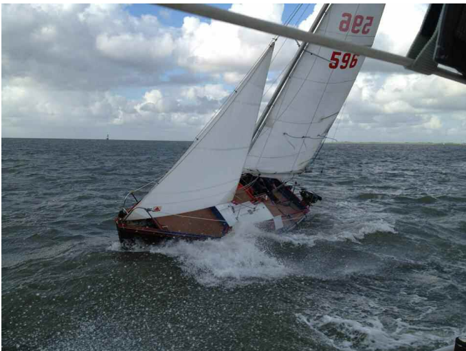
Bootstour mit der Flirt - Schweres Wetter kündigt sich an!