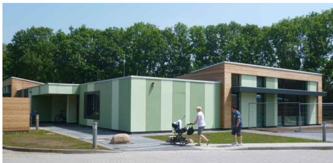
Die Kinderkrippe der Jade Hochschule

Die Kinderkrippe der Jade Hochschule ist fertig gebaut und öffnete im April diesen Jahres ihre Tore. Die Kinderkrippe nimmt Kinder bis zu einem Alter von 3 Jahren der Studenten und Beschäftigten der Jade Hochschule und der Wilhelmshavener auf.