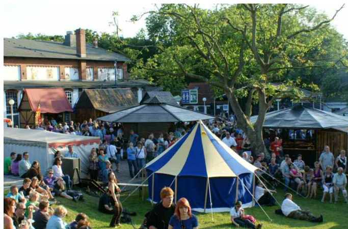
Es war viel los im Hexendorf am Pumpwerk

Vom Pumpwerk, wo historische Marktleute, Künstler, Piraten und Rittersleute die Besucher einladen, an ihren Marktständen zu stöbern und zu feilschen, über die Wiesbadenbrücke, wo es allerlei Oldtimer zu bestaunen gab, bis zum Bonte Kai und Südstrand wurde an Ständen gestöbert, gegessen und getrunken. Kulinarisch reichte es von Fisch über Crêpes bis zur mediterranen Küche und Grillspezialitäten. Ein Flohmarkt auf der Deichbrücke und die Kirmes am Hafen rundeten das Angebot ab.