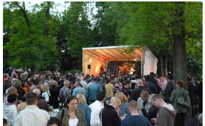
Pumpwerk - Aussenansicht mit Bühne