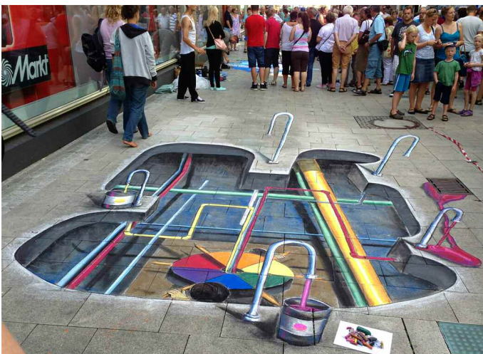
Shawn McCann (USA) fertigte dieses beeindruckende wunderschöne 3D-Gemälde!

Eine Premiere gab es auch beim Wetter. Erstmals schien während des ganzen Festivals die Sonne. Trotz des Strandwetters strömten vor allem während des verkaufsoffenen Sonntags zehntausende Besucher aus nah und fern in die Stadt zu Kunstgenuss und Einkaufsbummel.