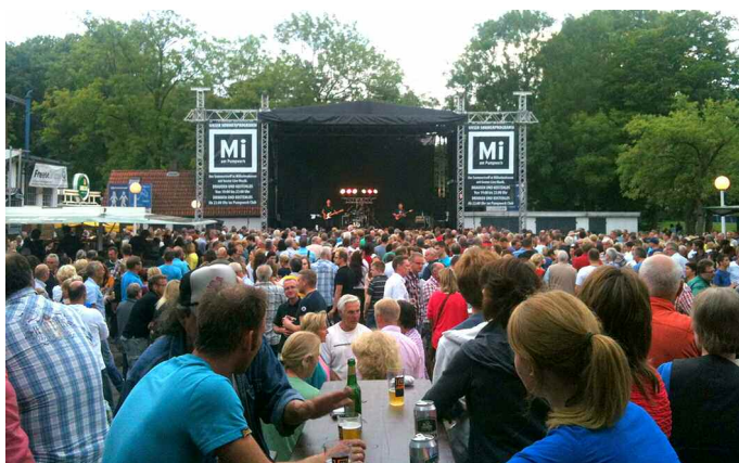
Pumpwerk - direkter Blick auf die Bühne

Mittwochs am Pumpwerk fand dieses Jahr zum zehnten Mal statt und hatte dafür wie gewohnt ein tolles Programm auf die Bühne gestellt. Bei Bratwurst und Bier konnte man sich wunderbar die Konzerte mit Freunden ansehen und den Tag ausklingen lassen. Der Eintritt war wie immer kostenlos!