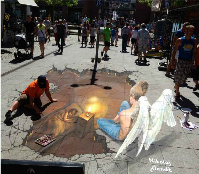
3D Künstler: 1 Platz Großartig ist das 3D-Kunstwerk von Nikolaj Arndt (Deutschland)

Das Besondere daran: Dieses Kunstwerk eröffnete dem Besucher einen detaillierteren Einblick in die 3D Malerei, anders als er es von den bisherigen Bildern gewohnt war. In diesem Jahr lag der Schwerpunkt nicht in der Größe. Das größte 3D Bild der Welt gab es im vergangenen Jahr schließlich schon zu bestaunen. In 2013 ging es mehr um das Detail.